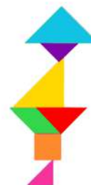
Le mineur avec son casque