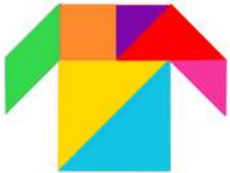
Le bleu de travail