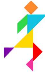
Le mineur en retard au travail