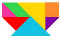
La berline de charbon (wagonnet)