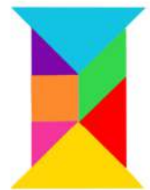
La lettre i