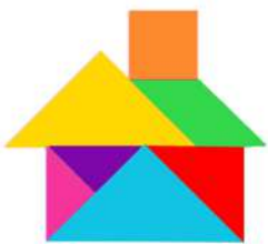
La cité minière