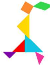
La femme du mineur