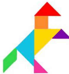
Le cheval qui permettait de tirer les berlines